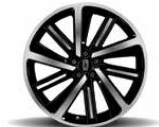
19-inch Rim 225/45 R19