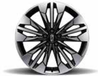
18-inch Rim 215/55 R18