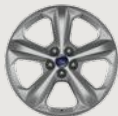
18" Sparkle Silver-Painted Aluminum Standard: SE