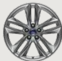
18" Sparkle-Silver Painted Split-Spoke Aluminum Standard: SEL