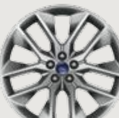
20" Polished Aluminum with Dark Stainless-Painted Pockets Optional: Titanium