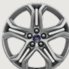
19" Nickel-Painted Aluminum Standard: Titanium