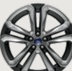
20" Polished Aluminum with Low-Gloss Magnetic-Painted Pockets Standard: Sport