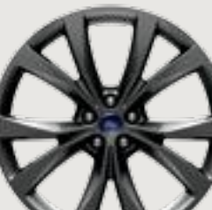
21" Premium Tarnished Dark-Painted Aluminum Optional: Sport