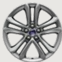
18" Polished Aluminum Available: SEL